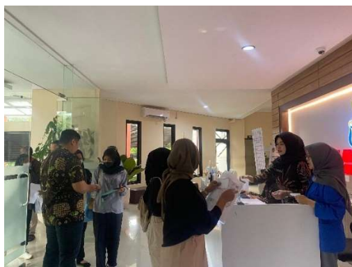
Foto Desk Layanan Informasi Publik

Disamping penyediaan ruang dan meja layanan informasi, untuk melayani permohonan Informasi publik secara langsung, PPID juga menyediakan layanan informasi publik yang dapat diakses melalui website https://dpmptsp.banyumaskab.go.id/ . Pemohon Informasi dapat dengan mudah mengakses layanan permohonan informasi secara online melalui website tersebut, kemudian permohonan informasi yang diterima secara online.